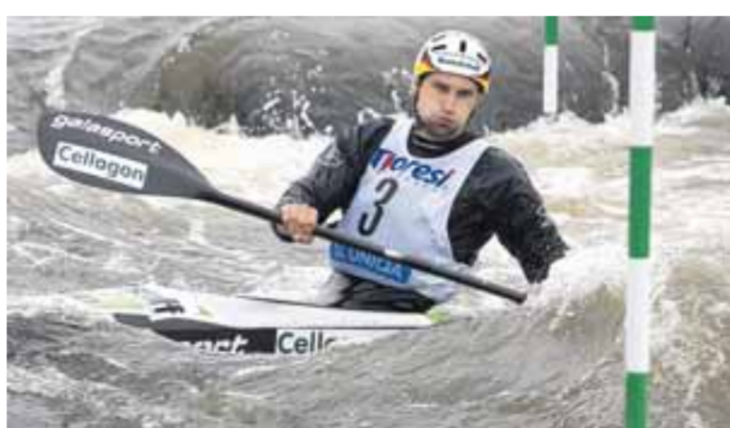
Kraftanstrengung zum Weltcupstart: Kajak-Olympiasieger Alexander Grimm war mit dem vierten Platz in Prag zufrieden.

Grimm fühlt sich in seiner Vorbereitung bestätigt und lässt sich auch durch die Zusatzqualifikation am Wochenende beim Weltcup in La Seu d'Urgell „nicht verrückt machen“.