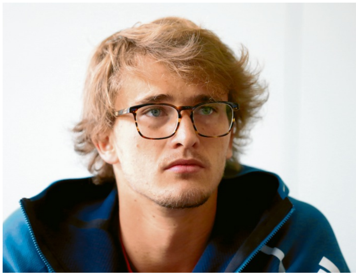
Der beste deutsche Tennisspieler Alexander Zverev steckt in einer Schaffenskrise. Das Turnier in München hat er in den vergangenen zwei Jahren gewonnen und soll auch jetzt die Rückkehr zu alter Stärke einläuten.

„Für mich ist es wichtiger, wie ich selber in Form bin und Tennis spiele und was ich auf dem Platz mache. Ob ich an 3, 2, 4 oder 5 gesetzt bin bei den French Open, ist mir relativ egal“, meinte der in diesem