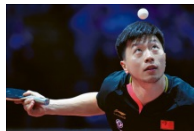
Chinesischer Ball-Zauberer: Ma Long besiegte im Finale den Schweden Mattias Falck.

kurz vor dem Achtelfinale im Einzel sowie dem Viertelfinale im Doppel wegen Fieber absagen. „Schade, dass es mich ausgerechnet bei dieser WM so plötzlich erwischt hat. Aber es kommen ja noch ein paar Chancen bei Weltmeisterschaften“, sagte der